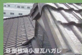
B 屋根鳩小屋瓦ハガレ