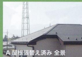
A 屋根張替え済み 全景

1年半前の突風で屋根が一部剥がれ、雨漏りがした為、古い事もあり屋根を全部張り替えました。その後、3ヶ月してから知人を通じて、保険の申請が出来る事を知り、申請支援を頼んだのですが、 工事が完了してからでも保険金が下りたのでビックリしました。