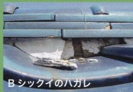
B シックイのハガレ